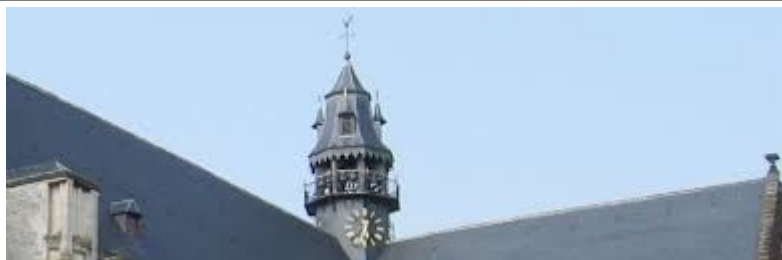
Diest Sint Sulpitiuskerk