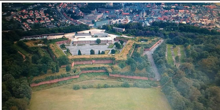
Diestse Citadel, Augustus 2019

Of vragen naar Dominique tijdens de CCMS bijeenkomsten