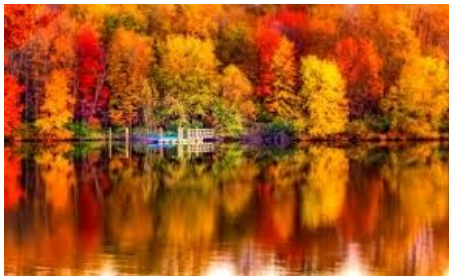
Mooi kleurpalet in de bossen