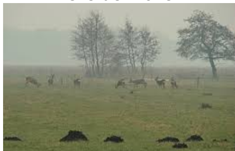
denken niet aan de winter