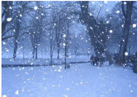
Hij is gevallen!