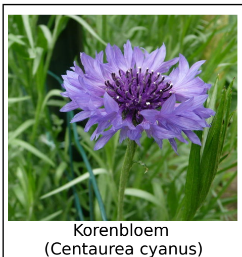
Korenbloem (Centaurea cyanus)

Officieel tijdschrift van CCMS, vereniging voor iedereen die computer als hobby heeft.