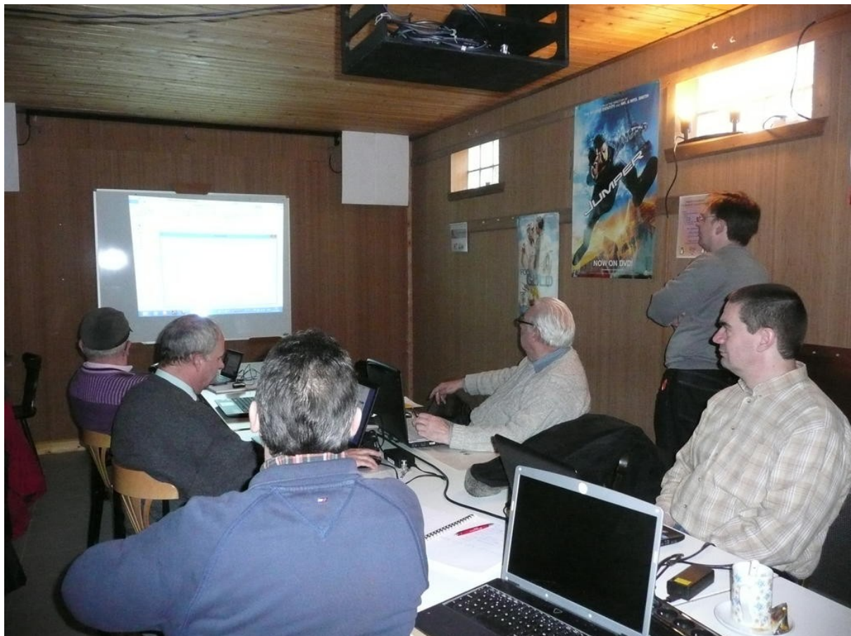
Een leuke demo door Boni over het gebruik van syncback