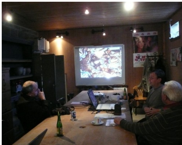
Weer een interessante demo over dia's inscannen.

Officieel tijdschrift van CCMS, vereniging voor iedereen die computer als hobby heeft.