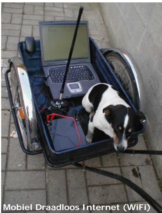
Mobiel Draadloos Internet (WiFi)

Officieel tijdschrift van CCMS, vereniging voor iedereen die computer als hobby heeft.