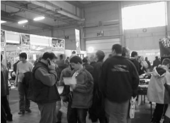
Bezoekers in overvloed.

ook standen die niet direct iets met pc's te maken hadden, zoals vb. de standen met GSM-toebehoren. Er was zelfs een stand waar je een vrachtwagen op afstandsbediening kon kopen. Zelf heb ik op de beurs van de gelegenheid gebruik gemaakt om enkele flatkabels aan te schaffen tegen een spotprijs, zaken te doen aan een stand waar ze "tangen om pluggen aan netwerk kabels te maken" verkochten, iemand achter een worstenkraam tegen te komen die ik maanden voordien op een cursus Linux had leren kennen en enkele boeken op de kop te tikken (pats!) over php, perl en mysql. Maar de meest opmerkelijke stand die ik er gezien heb dit jaar was een meubelstand. Jawel, iemand stond er met (zelfgemaakte?) houten computer en boekenmeubels. Tja, je weet maar nooit natuurlijk dat er iemand op de beurs veel koopt en zich dan realiseert dat hij geen plaats heeft thuis om alles te zetten en dan maar beslist om ineens ook nieuwe meubelkes te kopen.