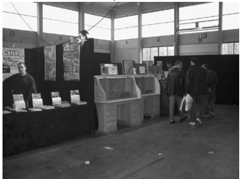
Zelfs meubels verkoopt men op een computerbeurs.